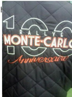
(モンテカルロラリークラシック 100周年記念ジャンパー)