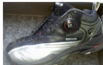
西尾フ口、赤土コーチ使用モデル 通常の紐の部分がダイヤル式になっている！ 紐の代わりに特殊加工されたワイヤー使用。