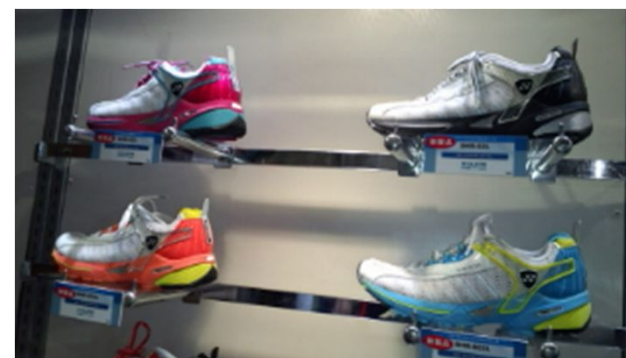
カラフルな色使いのランニングシューズ各種